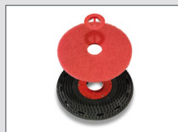
Plateau disque avec son système Padloc